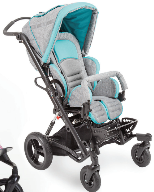
Ottobock Kimba Neo