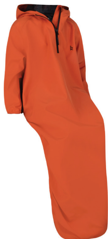
Regen- und Windschutz