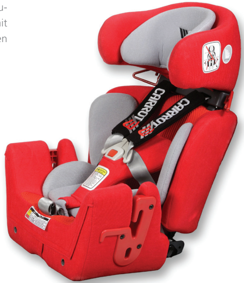
RehaNorm Carrot 3

Besonders komfortable und anpassungsfähige Autositze, die speziell für Kinder und Jugendliche mit einem Handicap ab einem Alter von ca. 2 Jahren hergestellt werden.