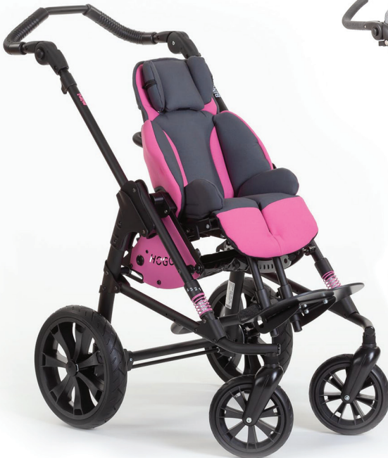
HOGGI Bingo Evolution Mini

große Auswahl an Zubehörteilen bieten, welche individuell für die nutzende Person angepasst werden können.