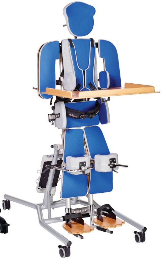
Rehatec Liegebär Lasse