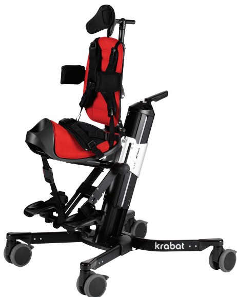
Schuchmann Dynamic Pacer